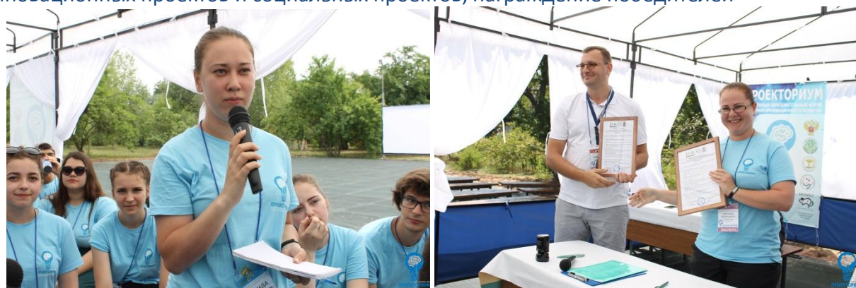
Фото и Видео с форума прошлого года, а также всю актуальную информацию по подготовке форума «ПРОЕКТОРИУМ-2019» Вы можете посмотреть в группе: https://vk.com/proectorium

Обучение написанию проектов, ежедневная работа с менторами, лифтовые презентации инновационных проектов и социальных проектов, награждение победителей