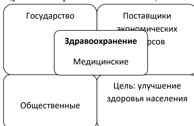
Схема 1. Субъекты экономических отношений здравоохранения как макроэкономическая корпорация.

С целью выработки важного управленческого решения, вам поручено определить с кем ваша медицинская организация должна установить договорные отношения и на каких условиях. Для этого установите взаимосвязи между субъектами макроэкономической корпорации здравоохранения (укажите стрелками на схеме 1.)