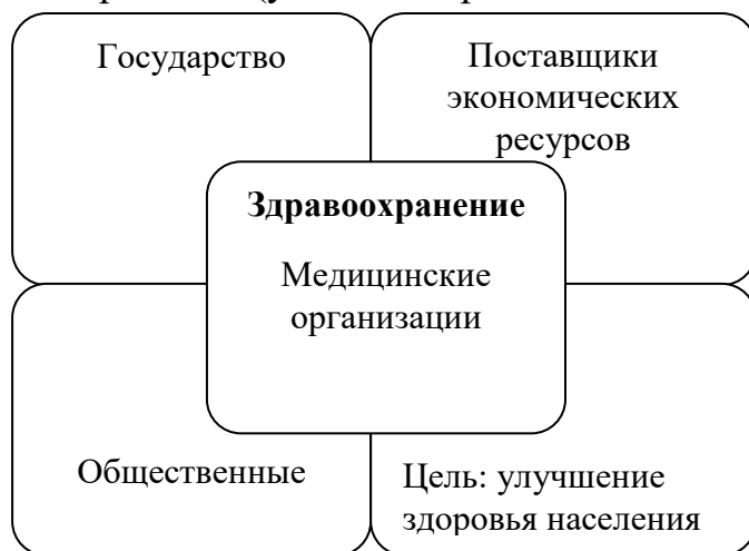
Схема 1. Субъекты экономических отношений здравоохранения как макроэкономическая корпорация.

С целью выработки важного управленческого решения, вам поручено определить с кем ваша медицинская организация должна установить договорные отношения и на каких условиях. Для этого установите взаимосвязи между субъектами макроэкономической корпорации здравоохранения (укажите стрелками на схеме 1.)