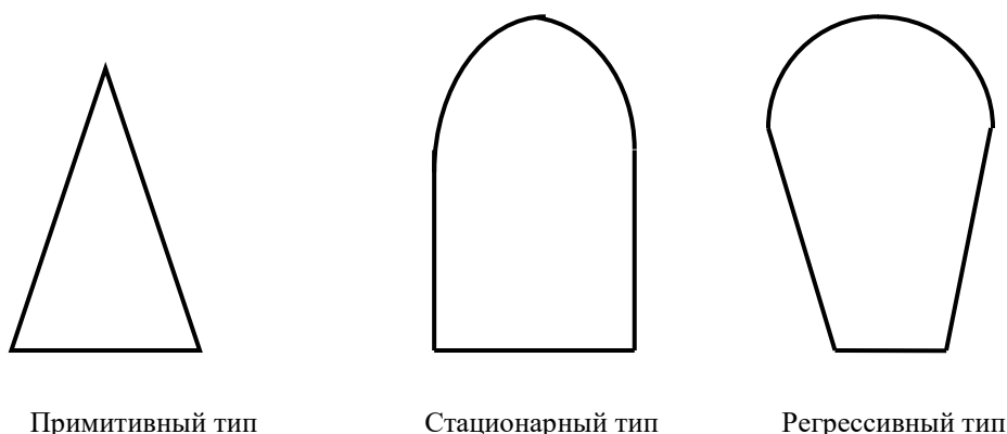
Рис. 1. Типы половозрастных структур

В действительности строгих типов половозрастных структур не бывает. Обычно бока пирамид имеют впадины и выступы. Впадина на пирамиде свидетельствует о малочисленности данной возрастной группы. Выступ характеризует многочисленную группу. На пирамиде можно проследить взаимосвязь между малочисленными, а также – между многочисленными группами. Если поколение рождается малочисленным (например, из-за войны или в условиях экономического кризиса), то, достигнув репродуктивного возраста (лет через 25-30), оно само также создаст малочисленную группу, и наоборот. Такое чередование малочисленных и многочисленных возрастных групп населения (впадин и выступов на пирамиде), повторяющееся через каждые 25-30 лет и постепенно затухающее к концу исследуемого века, называется «демографическими волнами» .