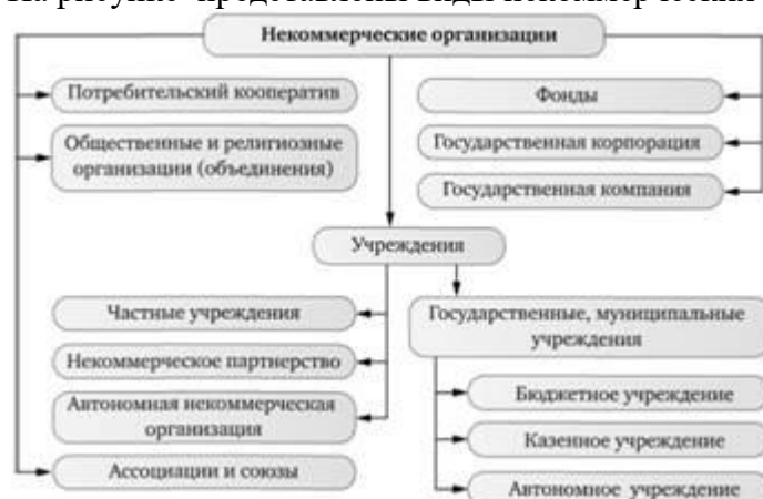
Рис. Виды некоммерческих организаций

На рисунке представлены виды некоммерческих организаций.