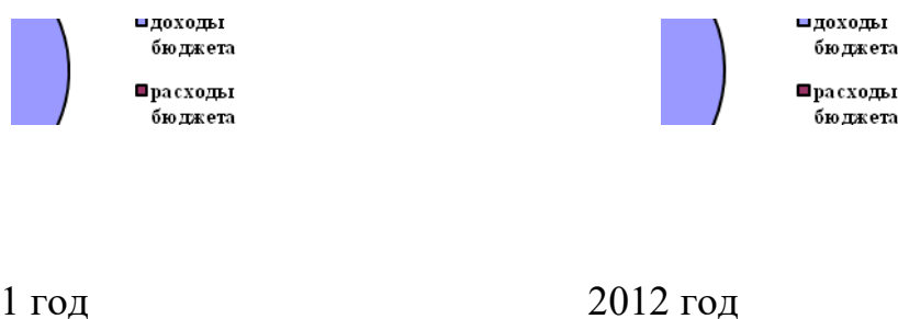
Рисунок 3 – Динамика изменения доходов и расходов бюджета за 2011-2012 гг.